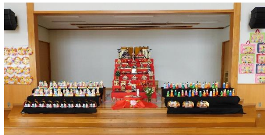
【ホールに勢揃いしたひな人形】

「ひな祭り」は女の子の成長を願う行事で、桃の花が咲く頃に行われるので「桃の節句」とも呼ばれています。雛人形は、子ども達の身代わりになって病気や事故から守ってくれると言われていて、ひな祭りは平安時代から続く伝統行事です。大切に受け継いでいきたいですね。煙山保育園では、一足早く、3月1日(金)にひな祭り誕生会のお祝いを行います。