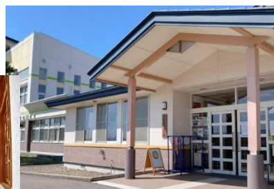
矢巾東小学校に隣接 していますので駐車場があります