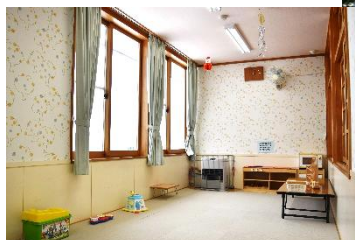
児童館内に専用の広場

矢巾町にお住まいの子育て家庭の遊び場です。 毎月1回の親子で楽しめる講習会があります。 親子でゆっくりつづる環境を整えて育児相談ができる 専任のスタッフがみなさんの来所をお待ちしています。