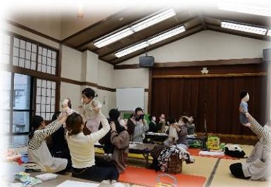
【レッツゴーベビー】