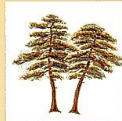
町の木 ● まつ

さわやかな鳴き声を矢巾の山々にこたませ、明るい未来を知らせ、町民に明日への希望をもたせてくれる。