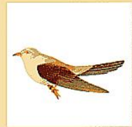
町の鳥 ● かっこう

南昌の里に、ひっそりと咲き、美しく、また可憐な花を開き柔和で、純潔な町民の心を表わしている。