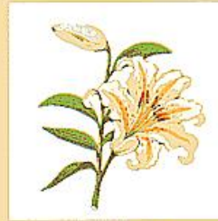
町の花 ● ゆり

南昌の里に、ひっそりと咲き、美しく、また可憐な花を開き柔和で、純潔な町民の心を表わしている。