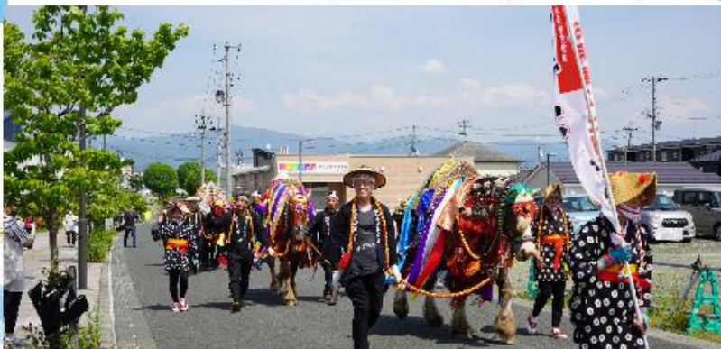
※昨年8月の「ス」とは異なります